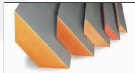
Sondergrößen auf Anfrage

Nur der ORIGINAL beza TK-R6 DACHRAND-TRAPEZKEIL bietet diese Qualitäts- und Montagevorteile!