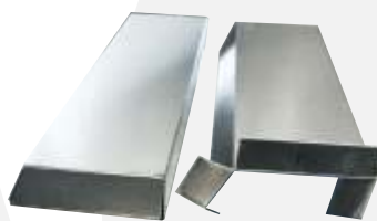
Endkappe/Endaufkantung in Fixlänge