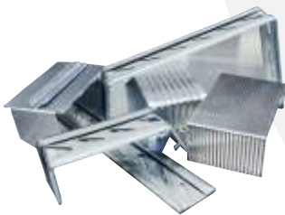
Halter & Stoßverbinder

Für die rationelle und fachgerechte Montage fertigen wir die Eck-, End- und Sonderformstücke nach Baumaß in Fixlängen an.